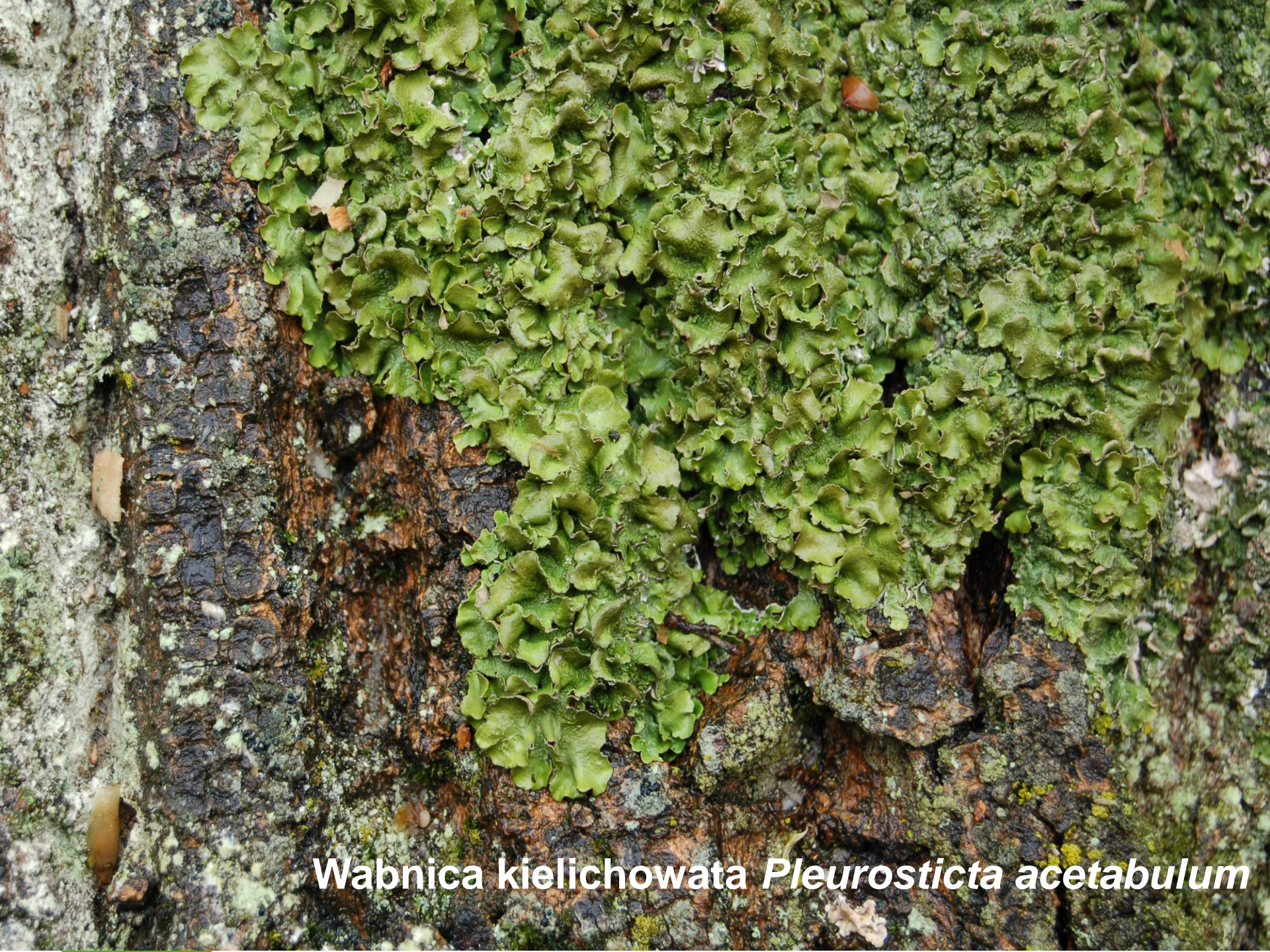
Wabnica kielichowata Pleurosticta acetabulum