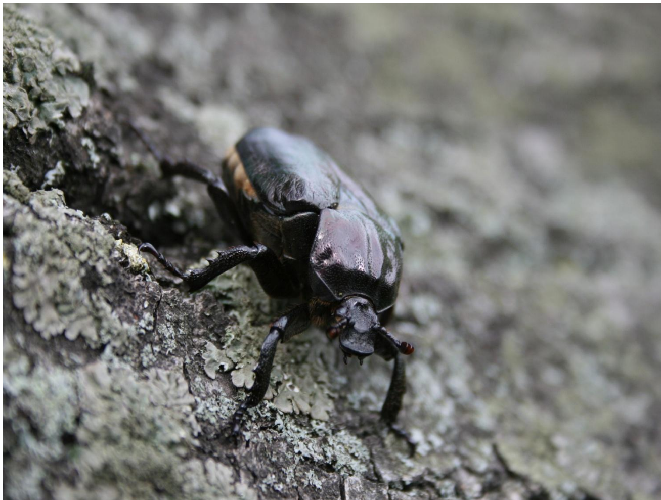
Dokumentacja z zasobów RDOŚ w Gdańsku