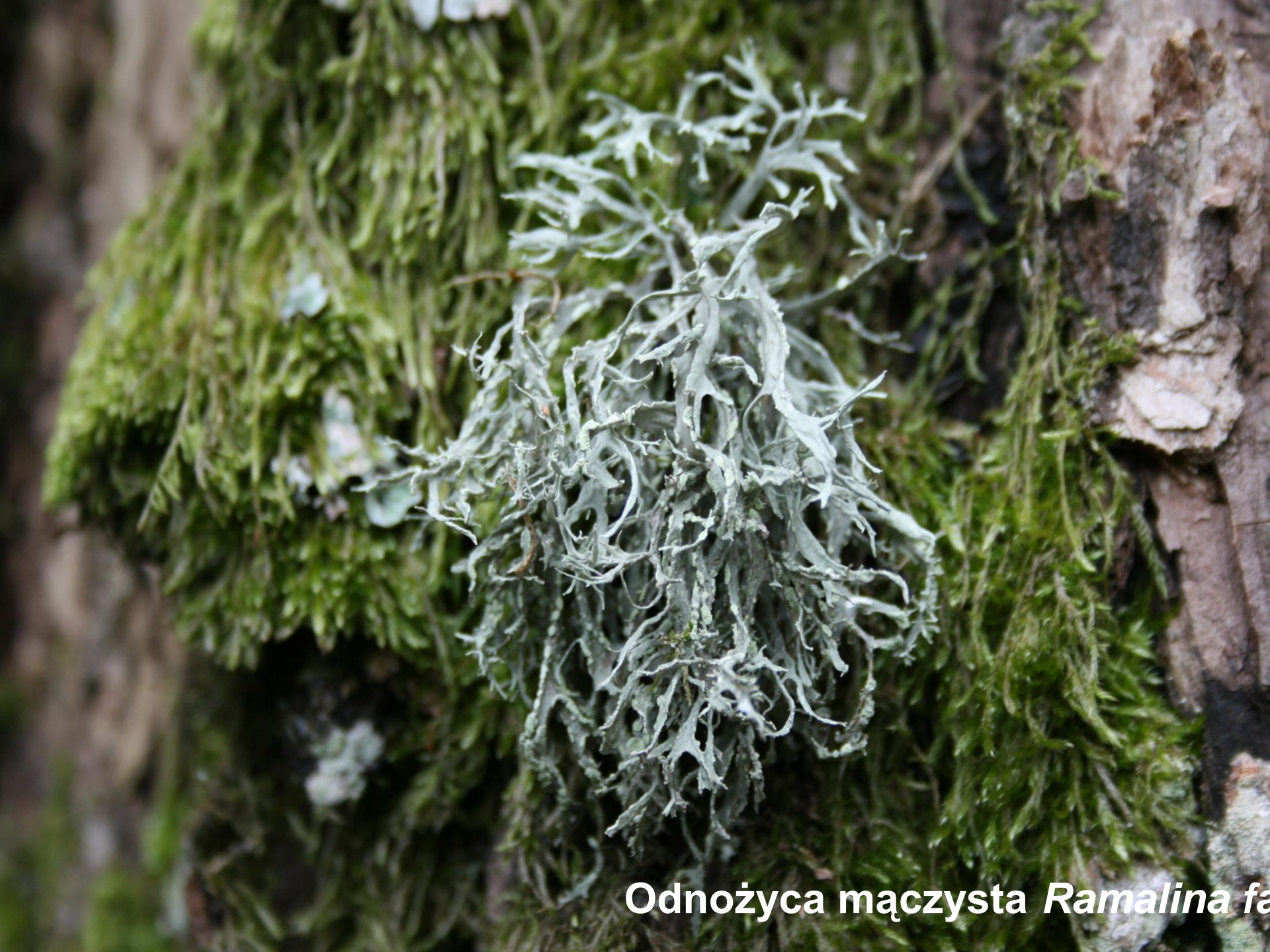
Odnożyca mączysta Ramalina farinacea