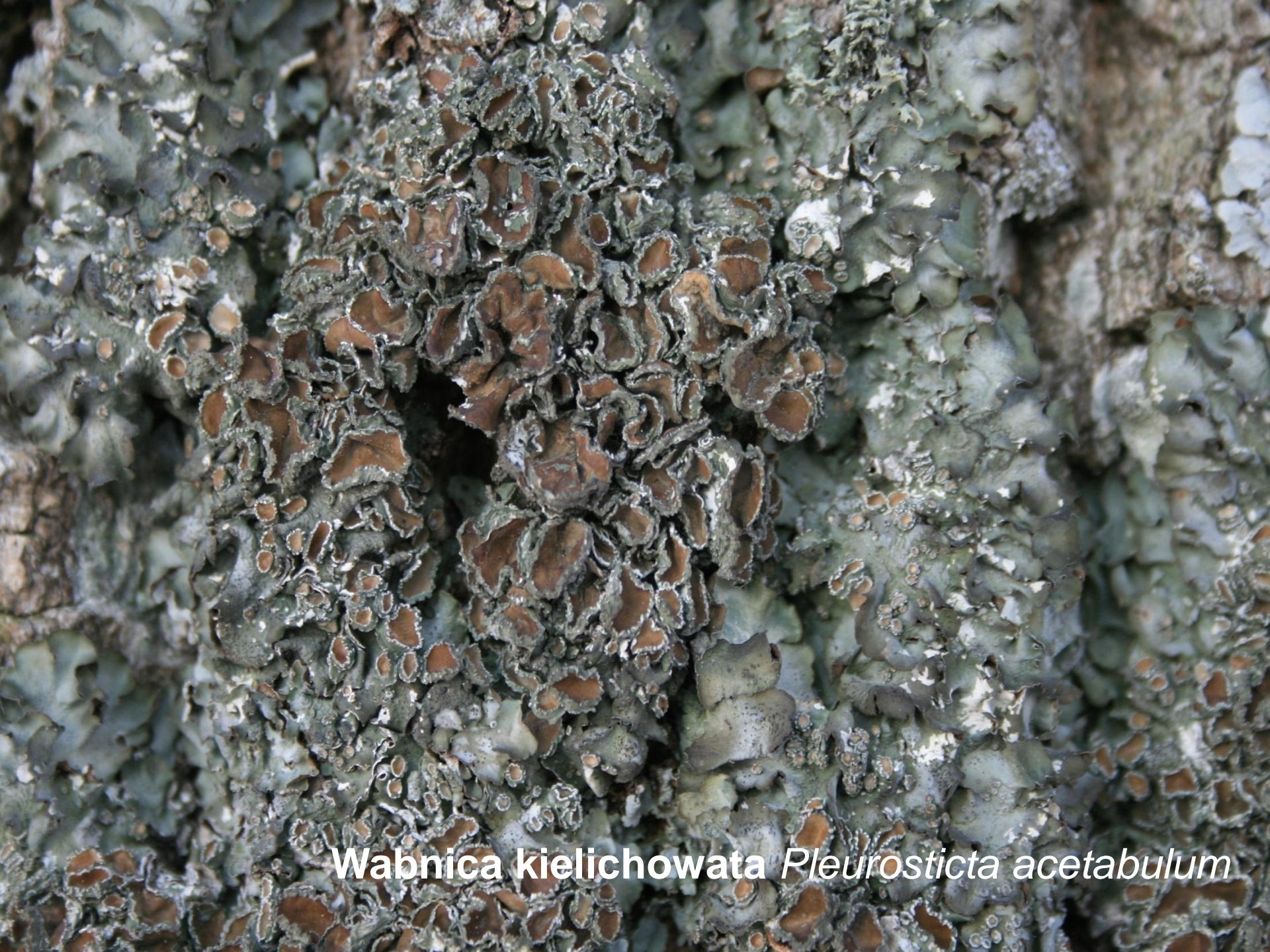
Wabnica kielichowata Pleurosticta acetabulum