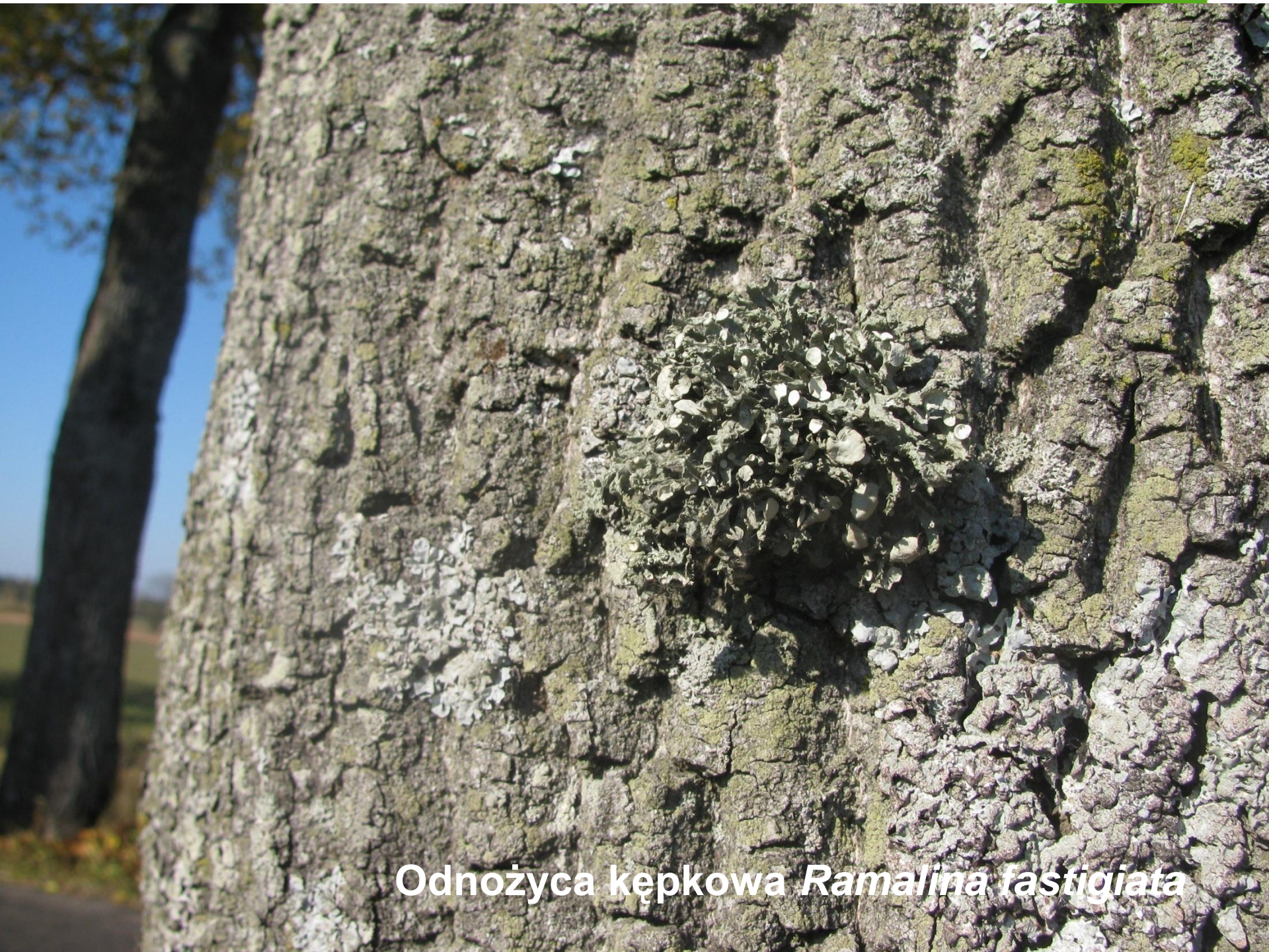
Odnożyca kępkowa Ramalina fastigiata