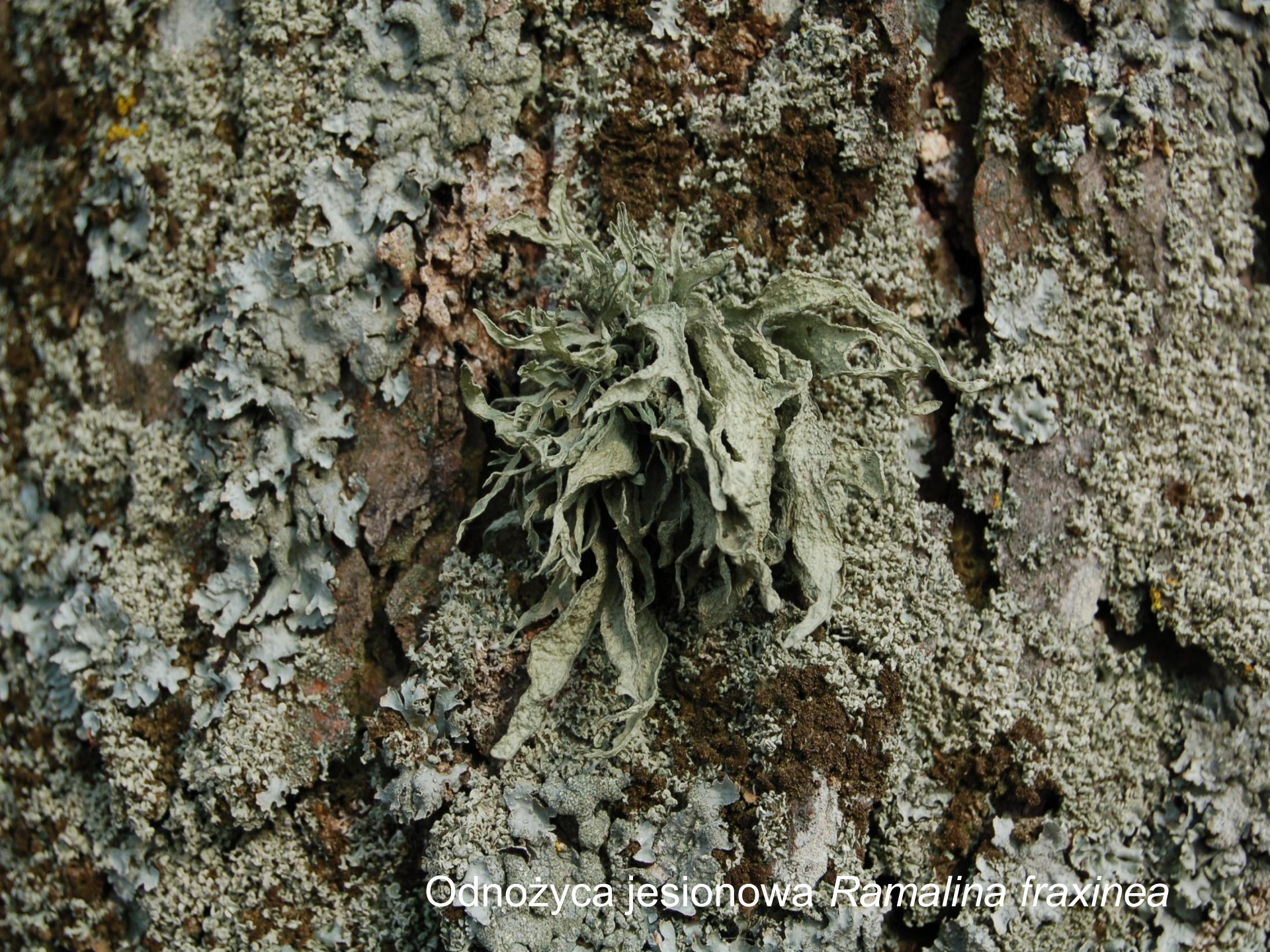
Odnożyca jesionowa Ramalina fraxinea